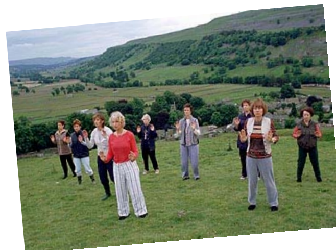
Comune di Rovigo

Per informazioni: Sezione Tributi del Comune di Rovigo Viale Trieste n. 13 tel. 0425/ 206.514 - 515 - 528 (info TIA) tel. 0425/ 206.514 - 515 - 516 (info ICI) dal lunedì al venerdì: 9.00 - 12.30 martedì e giovedì: 15.15 - 17.30