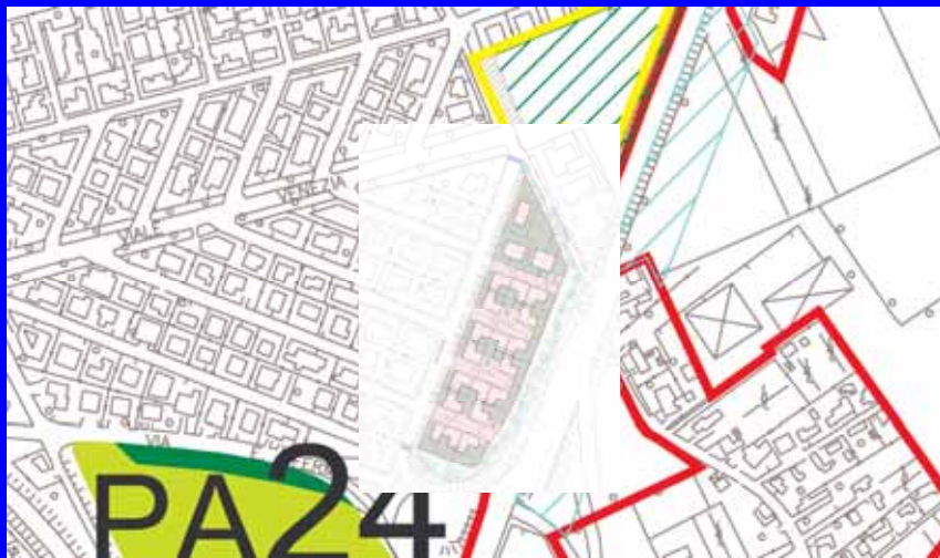
INSERIMENTO ZONIZZAZIONE P.I.R.U.E.A