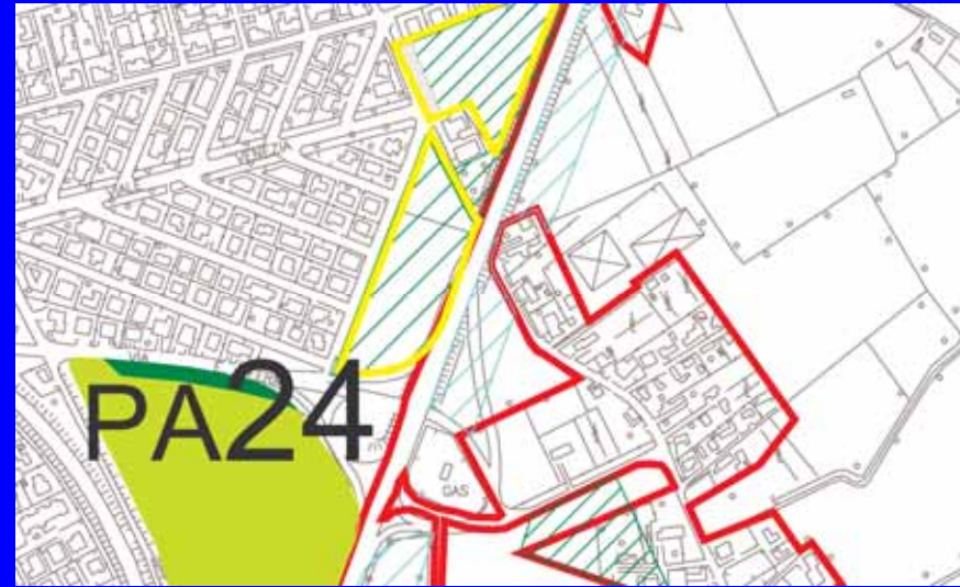
CARTA DEI SERVIZI ATTUATI E NON ATTUATI