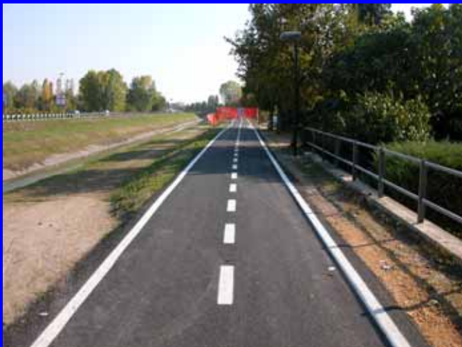
Pista ciclabile Centro-Ospedale Lungh.compressiva 2km 300m

OPERE REALIZZATE: M226 PISTA VIA ASIAGO (€22600), SISTEMANZIONE PORTICI VIA BADALONI (€ 356410), SPOGLIATOI CAMPO DI CALCIO BOARA POLESINE (€18570).